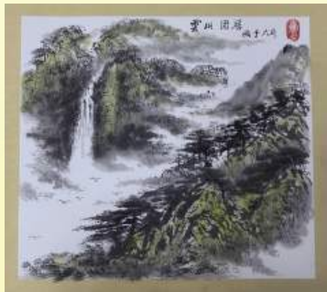
孔宪玉《云山固居》绘画类第三名